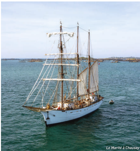
Le Marité à Chausey