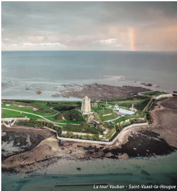
La tour Vauban - Saint-Vaast-la-Hougue