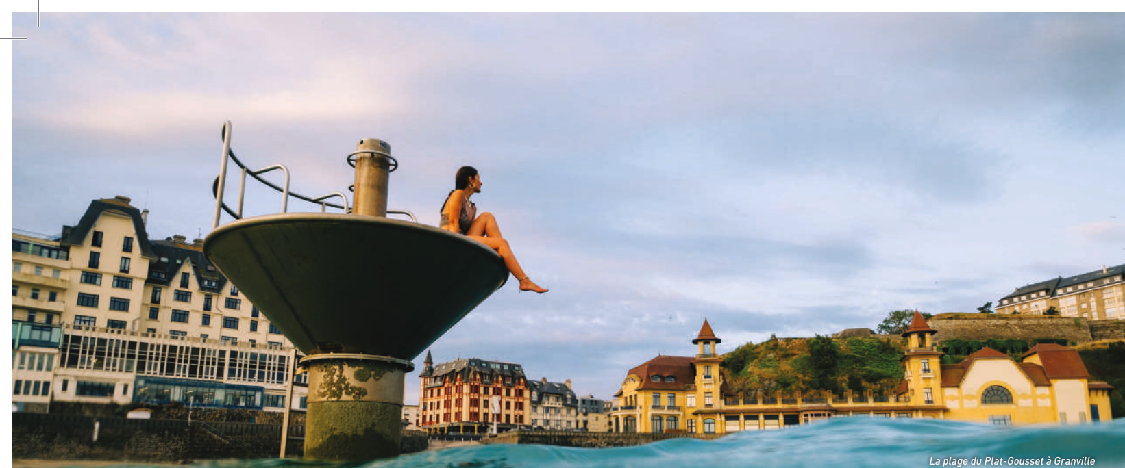
La plage du Plat-Gousset à Granville