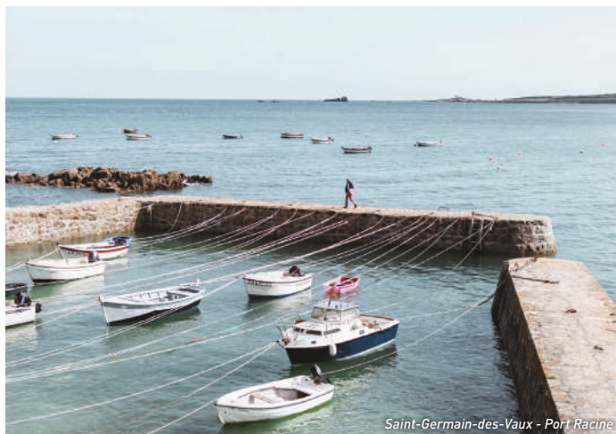
Saint-Germain-des-Vaux - Port Racine

Ce territoire offre des paysages à couper le souffle et le tour peut en être fait par le sentier des douaniers (cf. page 15). De jolis coins à découvrir ; La Mare de Vauville, Le Nez de Jobourg, Le Port Racine, Le Raz Blanchard, le Phare de Goury ... Cette côte peut être également admirée et commentée depuis la mer : hagueapart.com