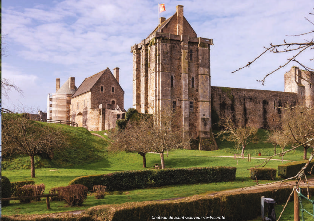
Château de Saint-Sauveur-le-Vicomte