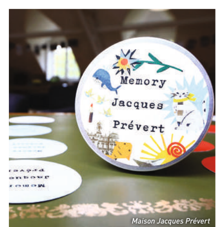
Maison Jacques Prévert